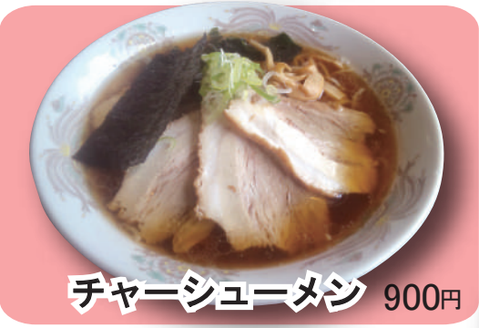
チャーシューメン 900円