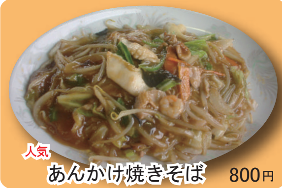
人気 あんかけ焼きそば 800円