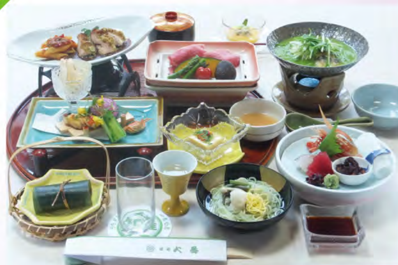
※季節により、料理内容・器等が替わります。