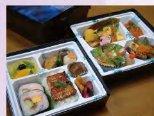
持ち帰り膳 一例 ご予算に応じます 是非ご相談下さい