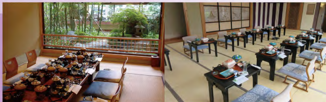
大小各お部屋をご用意 しております。