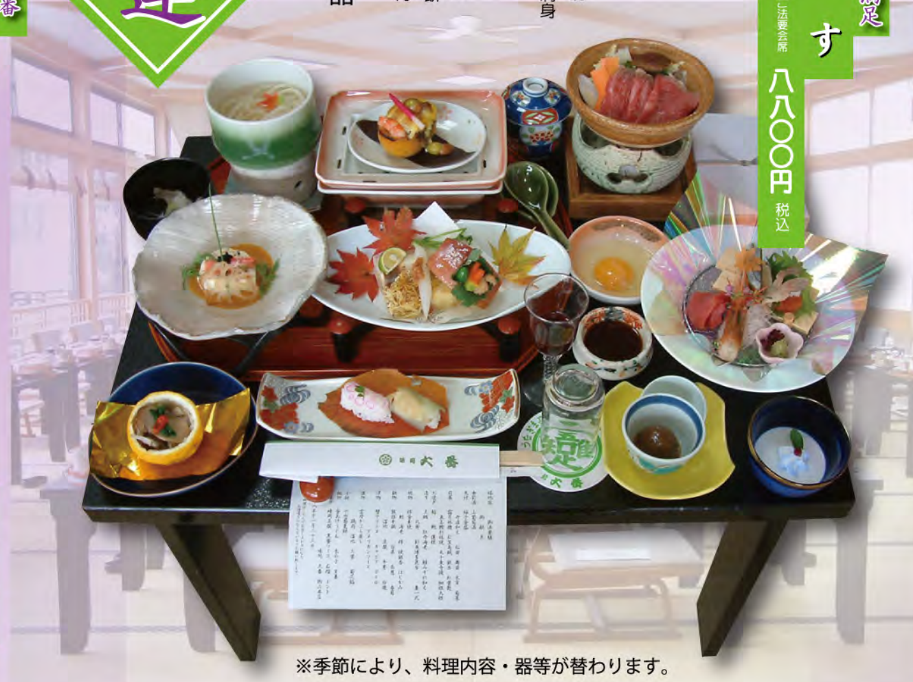
※季節により、料理内容・器等が替わります。