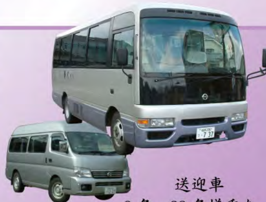
送迎車 9名・28名様乗り