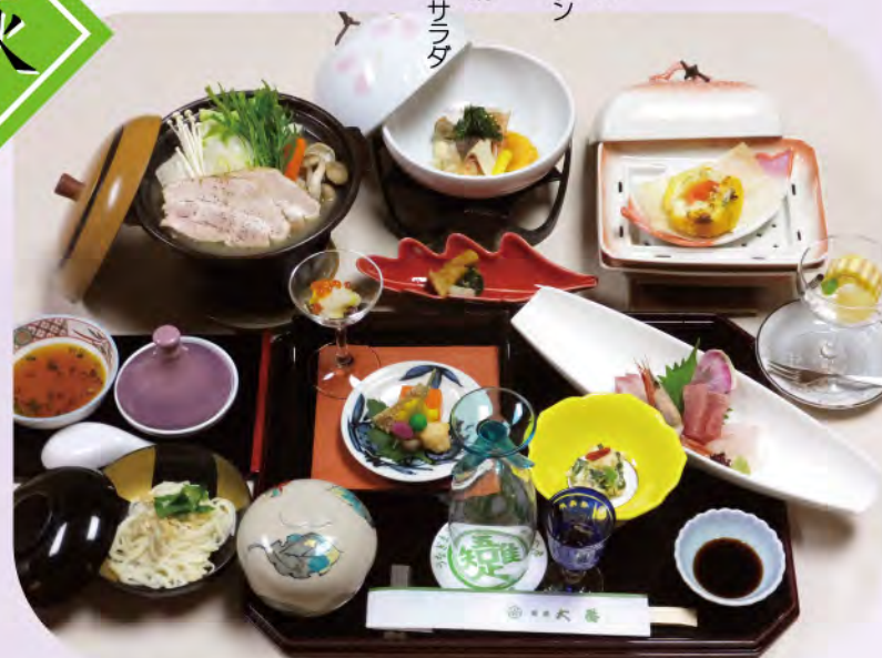
※季節により、料理内容・器等が替わります。