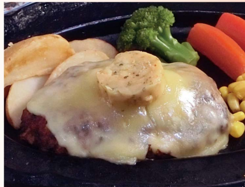
チーズ ハンバーグ(单品) 1,190円 (税込1,309円)