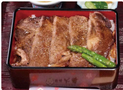
もうもう重 ~ リブローズを使用したステーキ重 ~ 2,591円 (税込2,850円)