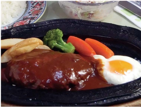
デミグラス ハンバーグ(单品) 1,090円 (税込1,199円)